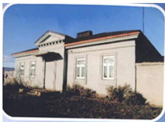
Фото 7. Почтовая станция