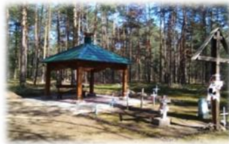
Фото 6. Щитковичская Проща