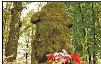
Фото 8. Камень-идол