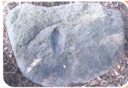
Фото 2. Камень-следовик