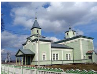
Фото 5. Свято-Геогриевская церковь