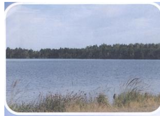
Фото 4. Озеро Скачальское