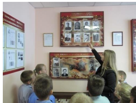
Фота 6. Музей Баявой Славы, аг. Пасека