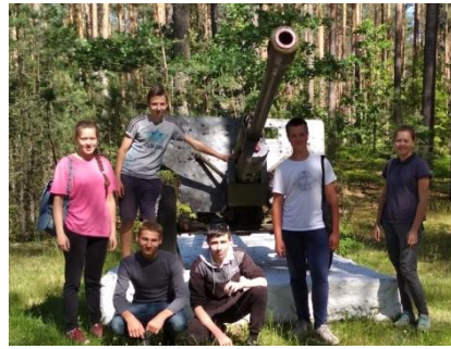
Фота 1-2. Мемарыяльны комплекс у гонар воінаў 121-й стралковай дывізіі