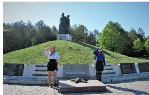
Фота 4. Помнік савецкім воінам і землякам, аг. Сінягова